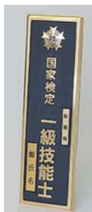
⑦ 1級屋外用門標 ¥11,000

ダイカスト仕上げ(級別) (縦 23.8 cm 横 16.6 cm 厚さ 2.8 cm)