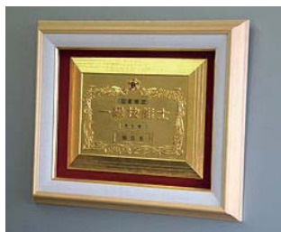
④ 1級(大) ガラス額入り ¥32,000

技能士としての誇りを持ち、社会的・経済的地位の向上に資するため、技能士章を掲げましょう。 また技能士カード・技能士手帳は、携帯に便利な商品です。