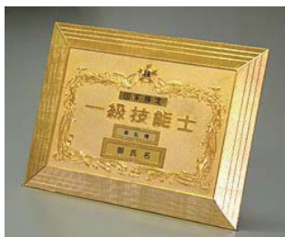
⑤ 1級(大) 店頭用 ¥19,500