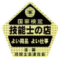
⑳ シール (2枚1組) ¥1,000