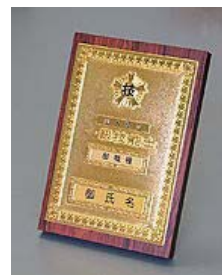
⑥ 1級机上用 ¥14,500

ダイカスト仕上げ(級別) (縦 23.8 cm 横 16.6 cm 厚さ 2.8 cm)