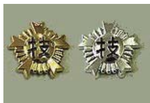
⑮ ヘルメットマーク 各 ¥700 (1級金色、2級銀色) (直径 4.0 cm)