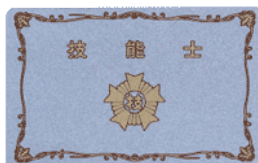
技能士カード ¥2,500 (縦 5.4 cm 横 8.6 cm 厚さ 0.8 mm)