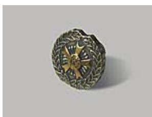
⑩ 全技連バッチ ¥1,600